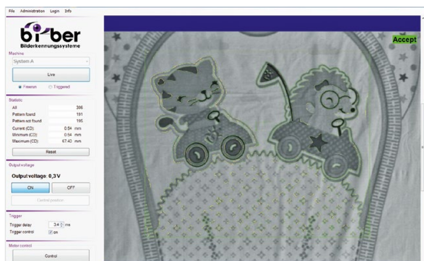
Programm-Oberfläche mit gefundenem Muster

Die Integration in die Automatisierungsumgebung und die Kommunikation mit Schwenkrahmen diverser Hersteller ist per analoger oder Profibus-Schnittstelle in verschiedenen Varianten möglich. Die analoge Ausgabe kann im Bereich von 0-10 V oder \pm 10 V erfolgen und ist damit zu alten und neuen Steuerungseinheiten (beispielsweise von BST) kompatibel. Das mehrsprachige Kamerasystem ersetzt so beliebige Sensorlösungen zur Seitenkantensteuerung .