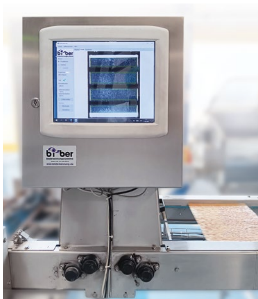
Komplettsystem auf der Anlage