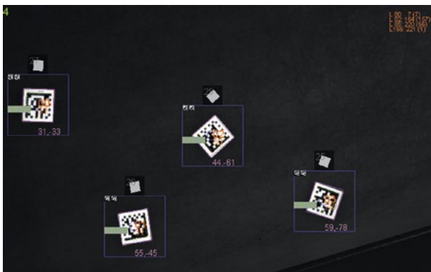
Kamerabild mit Ergebnissen

Die Lösung besteht aus einem Aufbau mit einer Kamera, die über den bewegten Spiegel eines Scanners blickt. Um die Codes vom Hintergrund zu trennen, wird ein beleuchtungstechnisches Verfahren angewandt, so dass allein die DMC hell in einem ansonsten dunklen Bild erscheinen.