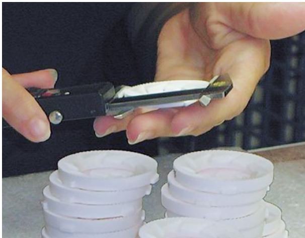
Frühere manuelle Messung

Die Anforderungen an diese Mahlscheiben sind hoch – schon eine Ebenenabweichung von 0,1 mm führt zu einer anderen Korngröße des Kaffees und damit zu einer Veränderung des Geschmacks.