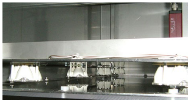
Innenansicht des Edelstahlschanks mit Kamera und LED-Beleuchtung

Nach der Typerkennung werden die Informationen an die Steuerung des Palettierroboters übermittelt. Kann kein Muster identifiziert werden, so werden die betreffenden Produkte ausgesondert und nicht palettiert. Im System werden zudem die aktuell verarbeiteten Brotsorten sowie die Nachfolge-Artikel aller Verpackungslinien eingestellt. Das Programm erkennt Nachfolge-Produkte automatisch und führt dann einen Artikelwechsel durch. Dieser wird dem Palettierroboter signalisiert, und die Palette wird ausgetauscht – so wird verhindert, dass gemischte Paletten in den Handel gelangen.