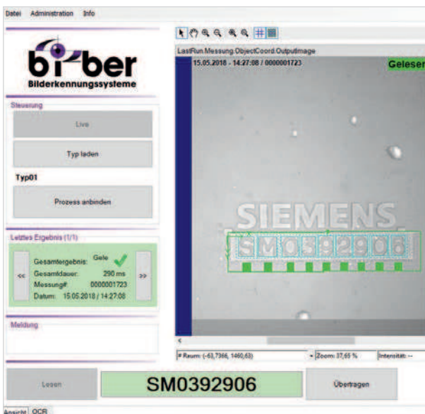
Benutzeroberfläche mit Leseergebnis

Applikation 2: ein weiteres Bildverarbeitungssystem, das ebenfalls als Handarbeitsplatz ausgeführt wurde, liest Seriennummern auf Keramikbauteilen . Der Prüfling wird auf einer Schublade unter die Kamera- und Beleuchtungsbaugruppe geschoben und dort mit Hilfe eines Kreuzlasers korrekt positioniert. Die Auswertung findet auf einem handelsüblichen Windows-PC statt. Die Software basiert auf Cognex VisionPro und verwaltet die Bildverarbeitung, den Prüfablauf und das eigentliche Lesen des Schriftzugs unter dem Hersteller-Logo.