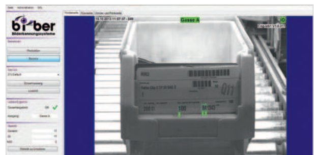
OCR auf KLT mit VisionPro

Auch hierfür bietet ein OCR-System von Bi-Ber die richtigen Lösungen. Das System liest automatisch die Zahlencodes und macht so die manuelle Steuerung durch Bediener überflüssig – es sorgt dafür, dass die KLT je nach Chargennummer weitergeleitet bzw. ausgeschleust werden. Bei nicht lesbaren Etiketten wird ein Anlagenstopp ausgelöst, sodass der entsprechende KLT durch Bediener identifiziert werden kann.