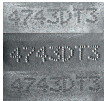
Aufnahmen eines Strings mit verschiedenen Beleuchtungskombinationen

Applikation 1: Für das automatische Lesen von Seriennummern auf hochwertigen metallischen Teilen wurde ein PC-basierter Handarbeitsplatz entwickelt. Schwierig hierbei war insbesondere, dass die Nummern im Metall graviert und somit schwer lesbar sind. Weder die Schriftart noch die Gravurmethode sind festgelegt, so dass eine sehr große Zeichenvarianz existiert. Hardwareseitig wurde das System deshalb mit mehreren Beleuchtungsarten ausgestattet: diffusen LED-Spots von zwei Seiten sowie einer großen und einer kleinen Ringlichtbeleuchtung. Diese Beleuchtungen können per Menü beliebig kombiniert werden.