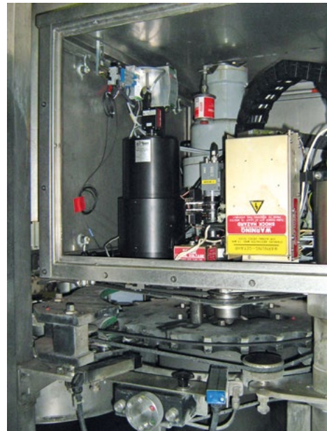
Einbausituation in bestehender Abfüllanlage

Die Bildaufnahme wird mittels eines Lichtsensors ausgelöst, der eine vorhandene Flasche in der Prüfposition meldet. Die Bedienung erfolgt mittels des Touchscreen-Monitors. Das System ist für helle oder dunkle Flaschen mit oder ohne Gewinde geeignet und erkennt Ausbrüche, Risse und starken Abrieb – die Auswertzeit für jeden Prüfvorgang beträgt etwa 60 ms. Die erfassten Daten werden vom Bildverarbeitungsrechner in einer Text- oder Bilddatei protokolliert und an die über-